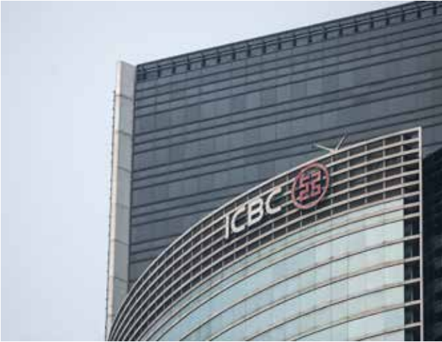
Chinas größte Bank, die Industrial and Commercial Bank of China Limited (ICBC) wird in Wien eine Niederlassung eröffnen, und auch Osteuropa betreuen.