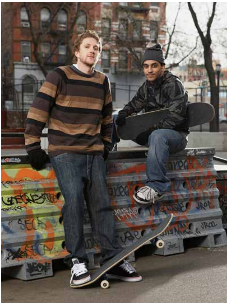
Jugendliche zwischen 15 und 25 Jahren die weder in der Schule, in Ausbildung, noch in Beschäftigung sind, erhalten eine Lehrausbildung in den Werkstätten der Stadt Wien.