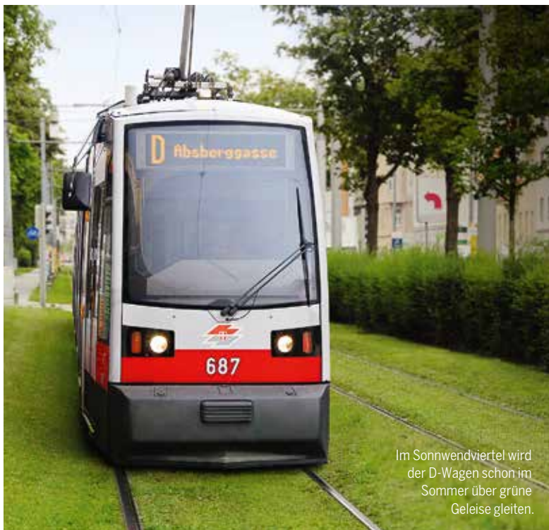
Im Sonnwendviertel wird der D-Wagen schon im Sommer über grüne Geleise gleiten.