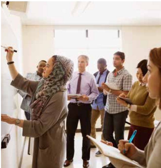
Erwachsenenbildung: Wer sich im Berufsleben weiterbilden möchte wird vom Wiener ArbeitnehmerInnen Förderungsfonds waff unterstützt.