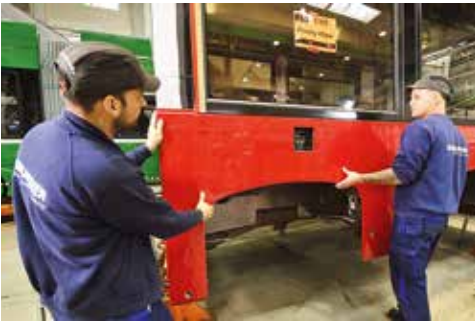
Die neue Flexity-Bim wird bei Bombardier gebaut.

Nordbahnhof fahren, der D-Wagen bis zur Absberggasse – außergewöhnlich ist die Führung über einen Kilometer Grüngleis im Sonnwendviertel. Ab Ende 2018 ist das erste von über 100 Niederflurfahrzeugen des Modells Flexity von Bombardier unterwegs. (Investitionsvolumen: 550 Millionen Euro). Auch die 450 Fahrzeuge zählende Busflotte wird bis 2019 mit 200 barrierefreie Euro-6-Busse runderneuert.