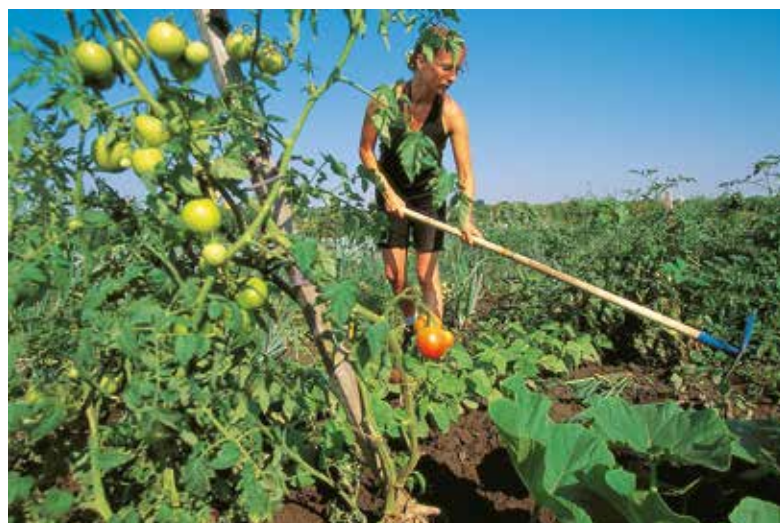
Die Ökoparzellen in Wien Donaustadt laden zum Garteln ein.

back-Modelle Geld. Außerdem: In der High-tech-Anlage Biogas Wien der MA48 liefern 22.000 Tonnen Küchenabfälle Biomethan, das in das Wiener Gasnetz eingespeist wird und 900 Haushalte mit umweltfreundlichem Biogas versorgt.