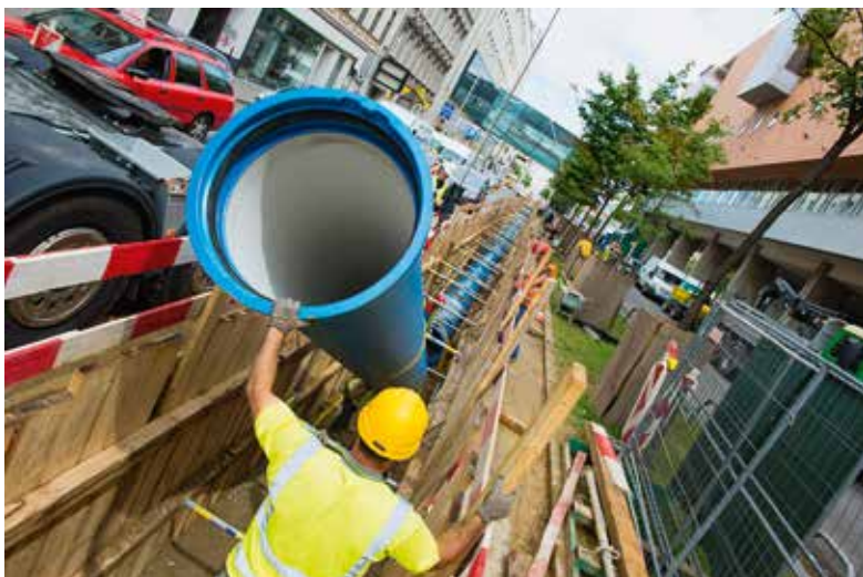
Rohrverlegungsarbeiten in Wien werden inzwischen zu einem großen Teil nach dem kostensparenden noDig-Verfahren umgesetzt – dabei werden neue Rohre einfach in alte eingezogen.

Lebensadern: Ob in der Entsorgung in der Müllverbrennungsanlage in der Spittelau, wie hier, die Versorgung über Wasserleitungen oder Wiens Energienetze; die Bewohner einer Stadt müssen mit Wasser und Energie versorgt werden, Müll und Abwasser müssen von der Stadt entsorgt werden.