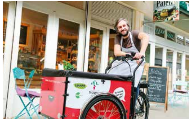
Heavy Pedals liefert für Biohof Adamah in Wien schon seit Jänner seine biologischen Produkte aus eigener Herstellung aus.

zuges von österreichweit fünf Mobilitätslaboren ausschließlich auf Güterverkehr und Logistik fokussiert. Posset: „Schon seit Jänner läuft ein Projekt mit Biohof Adamah und heavy pedals, drei weitere Pilotprojekte werden demnächst in Wien umgesetzt.“ Derweil hat der thinkport schon zahlreiche innovative Unternehmen an Bord (bzw. in den Hafentoren) geholt: Das E-Leicht-Kfz tom-tom mit einer Tonne Zuladung und 150 Kilometer Reichweite wurde im Oktober erstmals der österreichischen Öffentlichkeit vorgestellt und konnte getestet werden. Der Sion von Sono Motors als das erste serienmäßige Elektroauto, das seine Batterie durch die Sonne lädt, bat ebenso zum Test Drive.