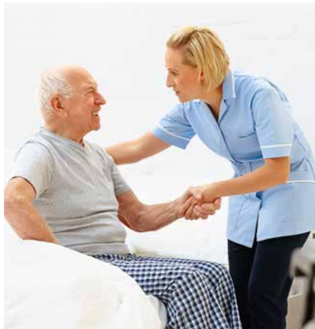
Mitarbeiter im Gesundheitsbereich sind gefragt. Der Bereich bietet gute Jobchancen. Die Stadt fördert eine Ausbildung auch finanziell.

SchulpsychologInnen, will Wien Vorreiter im Bereich innovativer Schulbildung sein. Darüber hinaus können die Schulen über den „Wiener Warenkorb“ hochwertige Schul- und Arbeitsmaterialien autonom anschaffen. In Summe stellt die Stadt dafür 8,8 Millionen Euro zur Verfügung.