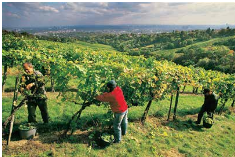
Weinernte in Wien: Das Weingut Wien Cobenzl bewirtschaftet Weingärten in der Größe von 60 Hektar in Grinzing, am Nussberg und am Bisamberg.