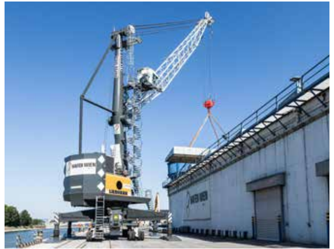
Wiener Hafen: Erzielte zuletzt ein Rekordergebnis und entwickelt sich zur internationalen Logistikdrehscheibe.