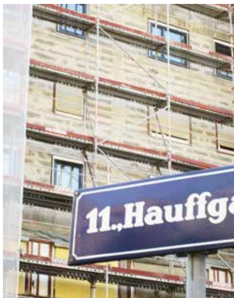
In der Wohnhausanlage Hauffgasse werden aktuell Wohnungen mit 50.000 Quadratmetern Gesamtfläche saniert.

In der Neuen Mittelschule am Enkplatz begeistert Smarter Together nicht nur mit geplanten Null-Energie-Turnsälen, sondern mit zwei innovativen Smart Benches. Diese gewinnen über Photovoltaikzellen Energie und die Schüler können ihre Smartphones anstecken und aufladen.